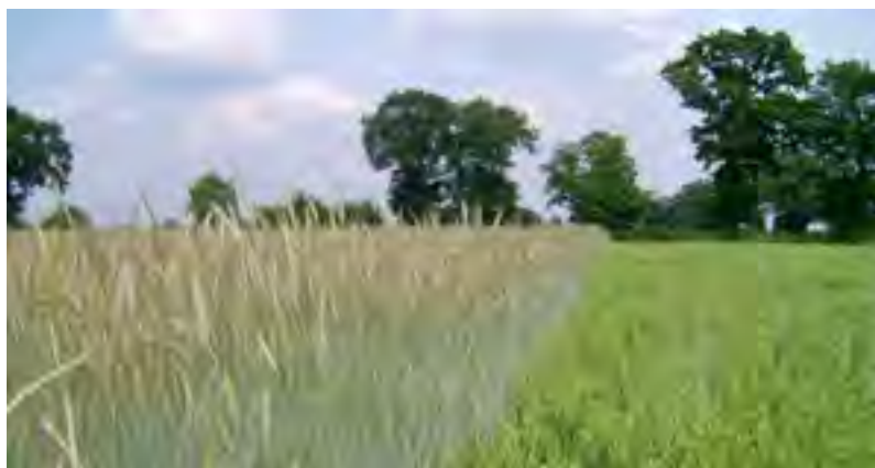
Seigle (à gauche) et avoine nue (à droite)