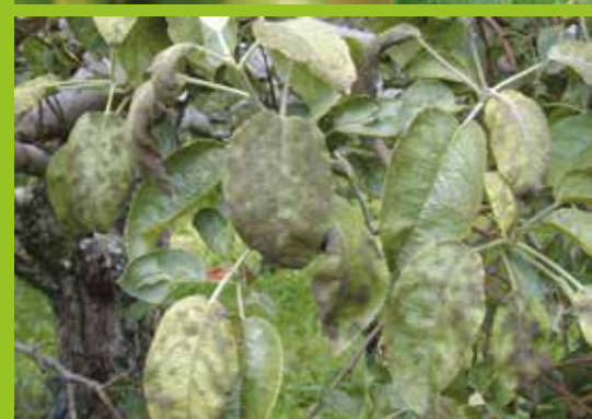
• Taches de tavelure sur feuilles