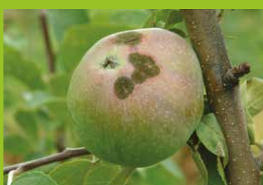
• Tâches de tavelure sur fruits